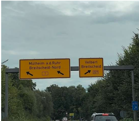
Autobahnabfahrt am Kreuz Breitscheid