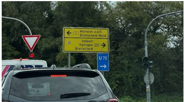
Autobahnabfahrt am Kreuz Breitscheid